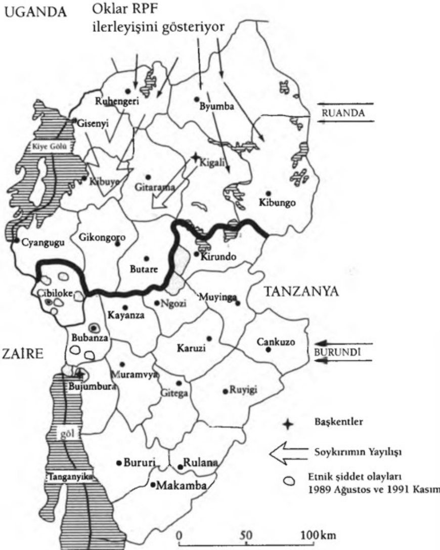
HARITA14.1. Ruanda ve Burundi'de vilayet ve eyaletler

bir kısmıydı. Fakat artık kuzeybatı himaye-yozlaş-ma sistemi, devletin ve kalkınma yardımı kaynaklarının gözde Hutu azınlığına gitmesine yol açıyor, Tutsi elitin ticaret temelli zenginliğine rakip çıkıp sonra da bu zenginliği geride bırakıyordu. Zenginliğe giden yol siyasi iktidardan geçtiği için Ruandalı Hutular artık gerçekten proleter bir millet değildi. Fakat artık Hutuların çok azı çeşmenin başında kana kana su içebildiği, onlar da esasen kentte yaşayan eğitilmiş kuzeybatılılar olduğu için ortalama Hutular ortalama Tutsilerden daha yoksul kaldılar ve proleter ideolojisinin daha potansiyel alıcıları haline geldiler. Ruanda'nın tüm mülle collines'inde, yani "bin tepelerinde" 3 sıradan polisler, okul hademeleri, kamulaştırılmış şirketlerin işçileri ve işlerini siyasi sınıfa borçlu alt düzeyde başka yiyiciler vardı. Yoksul da olsalar hiç himaye görmeyenlerden daha iyi durumdaydılar. Himaye şebekeleri binlerce kişiyi harekete geçirebiliyordu. Etnik eşitsizlikler Burundi'de daha belirgindi. Tutsiler hâlâ siyasi, askeri ve ekonomik güç tekeli ellerinde bulunduruyorlardı. Ekonomik güç ilişkileri soykırımın örgütlenmesinde ve yürütülmesinde anahtar rol oynayacaktı. Bu iki temizlik vakasında etnik ideolojinin ağırlığını