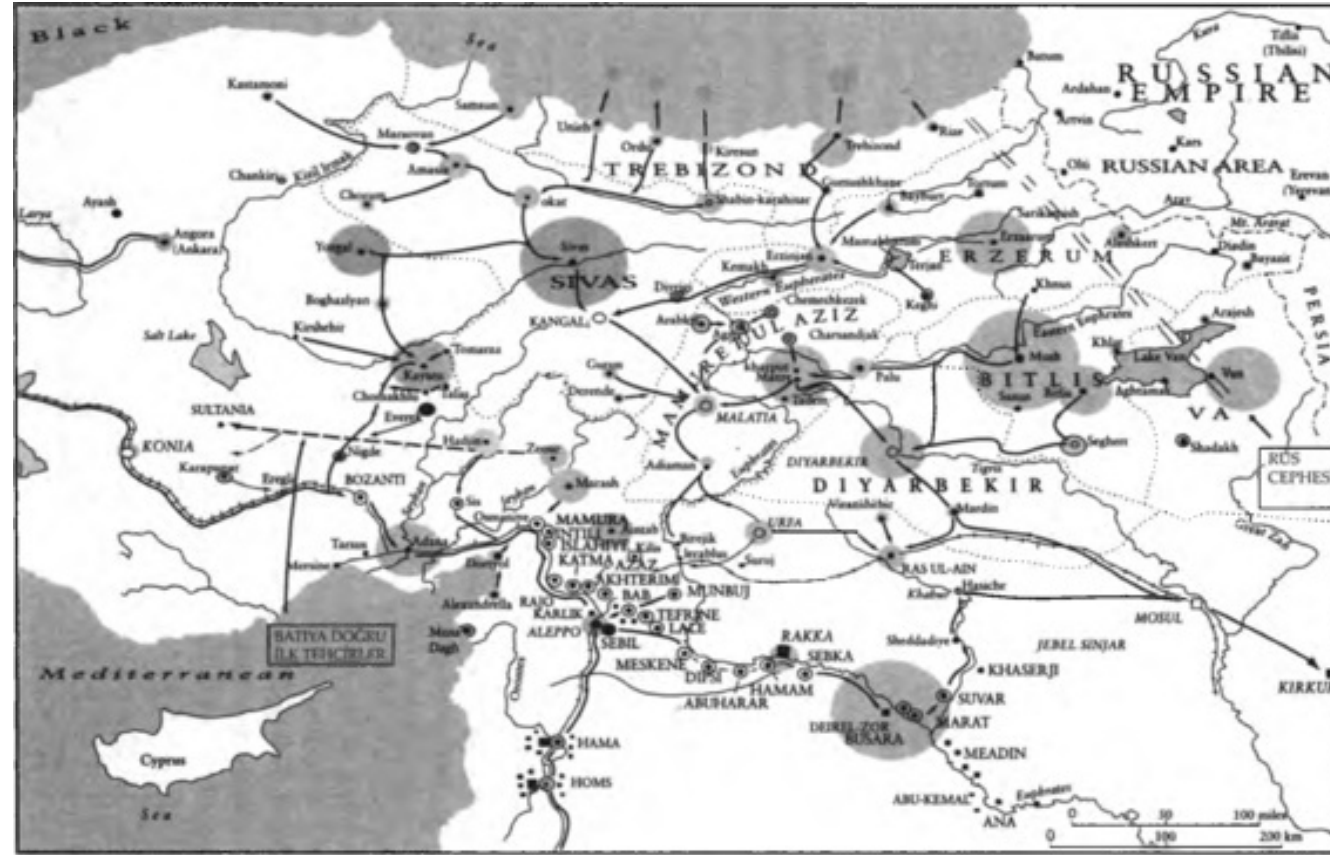
HARITA 6.1 Osmanlı İmparatorluğu'ndaki 1915 Ermeni katliamı.

hareket taktik cazibe dediğim bir unsuru barındırıyordu: Askeri bir taktik olarak taktikçileri çok daha kötü bir yere çekebilirdi. Şiddetin tırmanması neticesinde C planına dönüşmesi işten bile değildi: Ermenileri tüm savunmasız iletişim hatlarından ve cephe bölgesinden uzaklaştırma fikri tüm Anadolu'yu ve neredeyse tüm Ermenileri kapsayabilirdi. Güneydeki "daha güvenli" marjinal çöl alanlarına gitmeye zorlanmaları mümkündü. Bu tırmanış 1915 başındaki askeri felaketler yüzünden hız kazandı. Ocak sonunda Doğu Cephesi Rus baskısı altında çökmeye başlamıştı. İngilizler şubatta Süveyş Kanalı'nda ve nisanda Mezopotamya'da zaferler kazanmıştı. İngiliz deniz kuvvetlerinin kısa süre içinde Suriye sahil-